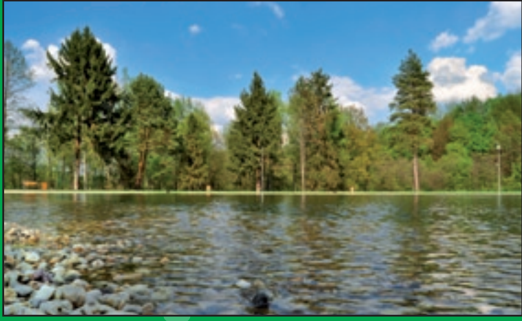
Rekreačná oblasť Sninské rybníky