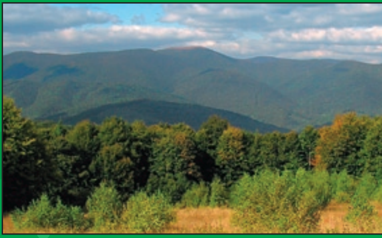
Slovensko-poľsko-ukrajinské pohraničie v oblasti Stужице