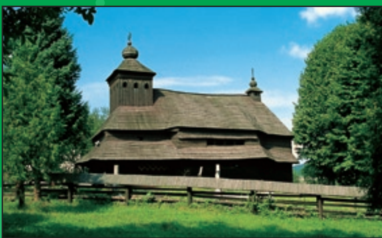
Drevený Chrám sv. Michala archanjela v Uličskom Krivom