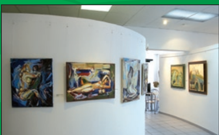
Galéria Andrej Smolák