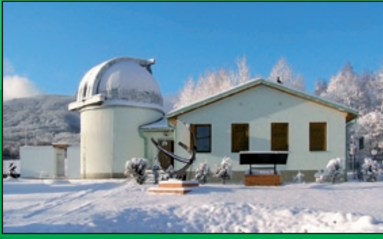
Astronomické observatórium v Kolonickom sedle