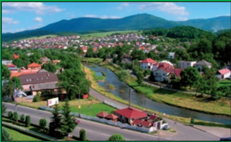
Panoráma Vihorlatských vrchov s miestnou časťou Brehy