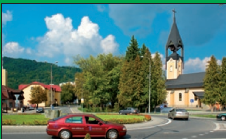
Námestie pri rímskokatolíckom kostole s kruhovým objazdom