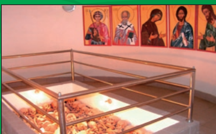
Kostnica – krypta vojakov, padlých v 1. sv. vojne v Osadnom