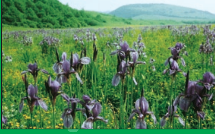
Prírodná rezervácia Hostovické lúky