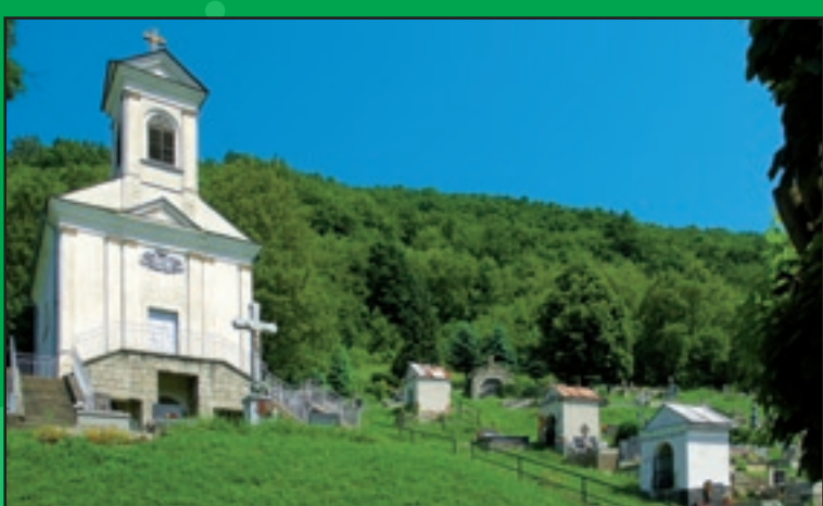
Kaplnka Sedembolestnej Panny Márie na Kalvárii z roku 1842