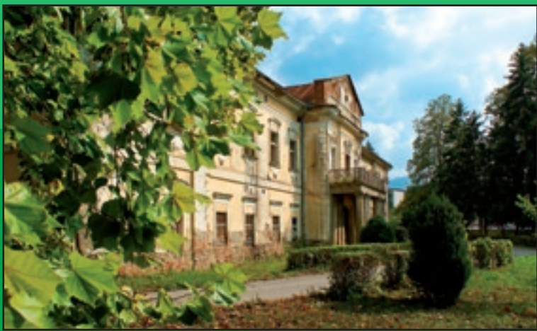
Klasicistický kaštieľ z roku 1800