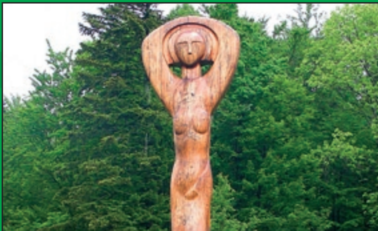
Drevená socha Medovej baby v Novej Sedlici