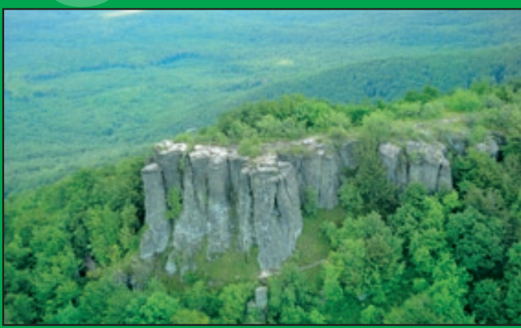
Skalné steny Sninského kameňa