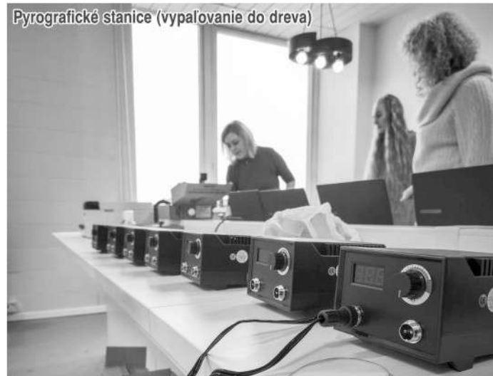
Pyrografická stanica (vypaľovanie do dreva)