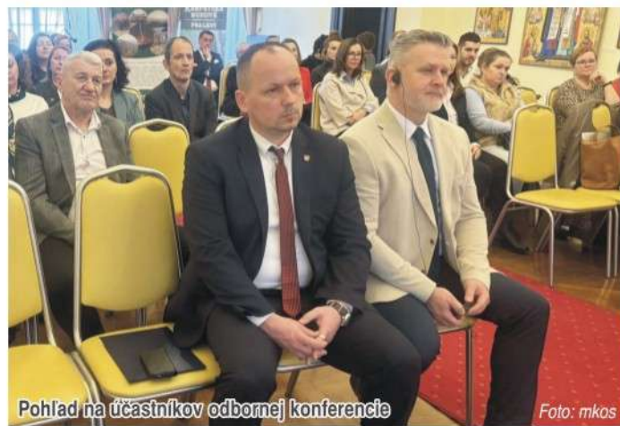
Pohľad na účastníkov odbornej konferencie