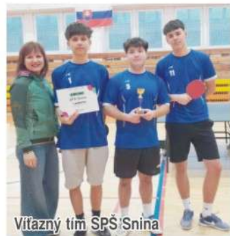
Víťazný tím SPŠ Snina

Vedenie školy im srdečne blahoželela k zaslúženému úspechu a drží palce v ďalšej fáze súťaže. (spš)