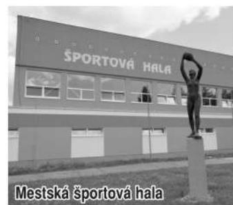
Mestská športová hala

1.3. - Albín - má latinský pôvod, v preklade znamená "biely". Títo muži majú v sebe dosť strnulosti. Ale ináč sú milí a občas tajuplní. O svojich súkromných veciach veľa nehovorí. Vždy vedia, čo chcú, i keď majú niekedy so sebou problémy. Ak nebudú dosahovať úspechy, budú smutní a sťažovať sa. Ale ak využijú svoje príležitosti a budú tvrdo bojovať, budú mať výborne výsledky.