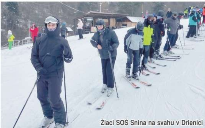
Žiaci SOŠ Snina na svahu v Drienici