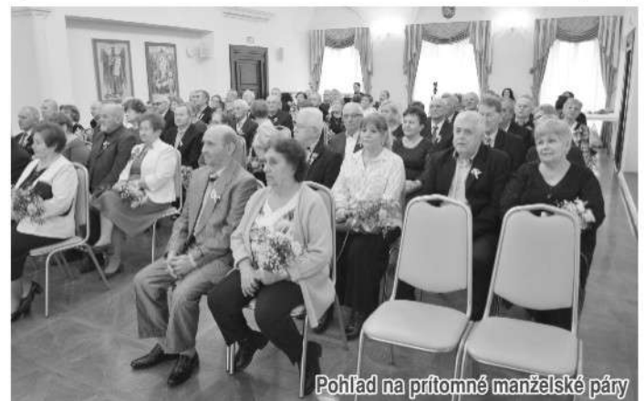
Pohľad na prítomné manželské páry