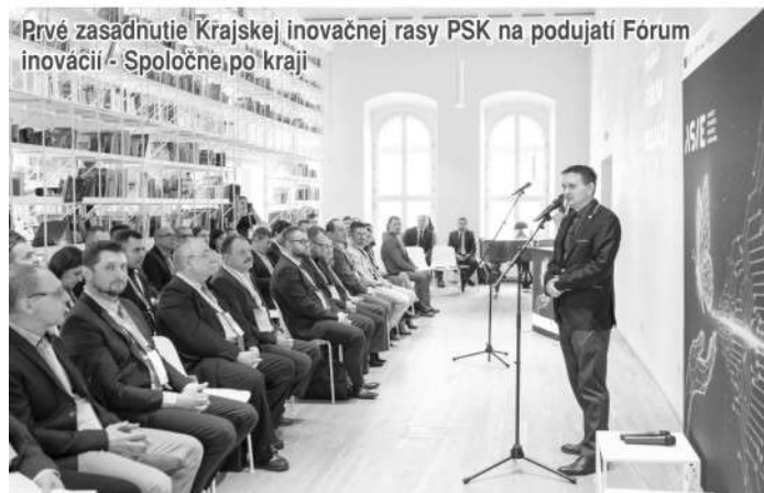
Prvé zasadnutie Krajskej inovačnej rady PSK na podujatí Fórum inovácií - Spoločne po kraji