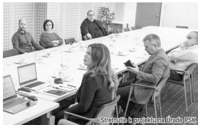
Stretnutie k projektu na Úrade PSK