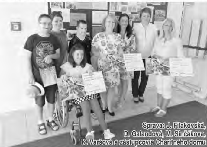
Sprava: J. Filakovská, D. Galandová, M. Sinčáková, K. Varšová a zástupcovia Charitného domu