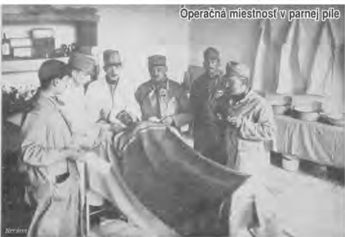
Operačná miestnosť v parnej pile