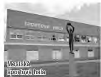
Mestská športová hala

Hasičský a záchranný zbor: 150, 112 Záchranná zdravotnícka služba: 155, 112 Linka záchranu života: 0850 11 13 13 Informácie o doprave (vlak, autobusy): 12 111 Polícia: 158, (Snina) 057/762 33 33 Mestská polícia Snina: 057/762 23 00 Pohrebné služby Snina: 057/762 21 66; 0905 492 442 Pomoc motoristom v núdzi: 18 124 Havarijná služba: 0123 Cestná záchranná služba (SČK): 154 Havarijná a núdzová služba pre motoristov: 18 128, 18 154 Linka dôvery Nezábudka - nonstop psychologické poradenstvo: 0850 11 10 22 Linka dôvery pre obeť domáceho násillia: 02/62 24 99 14; 0905 463 423