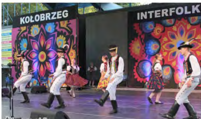
Šiňava na pódium