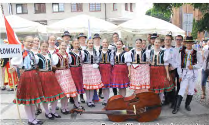
Pred tradičným sprievodom mestom