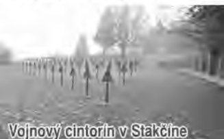
Vojnový cintorín v Stakčíne

Vojnový cintorín Stakčín I. sa nachádza na miernom návrší zvanom Panská Hora. Miesto posledného odpočinku tu našlo 960 vojakov. V období zriadenia bol samostatným cintorínom o výmere 6621 m 2 . Postupne splynul s obecným cintorínom. Pozostáva z 590 vojnových hrobov, z ktorých je 569 jednotlivých, 3 spoločné a 18 hromadných. Známych podľa mien je 495