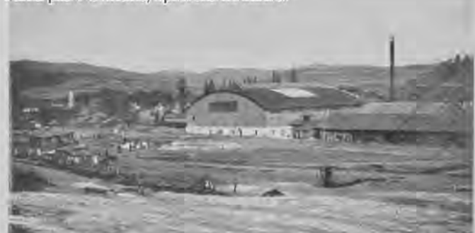
Parná píla ve Stakčíne nyní upravená v lazaret.