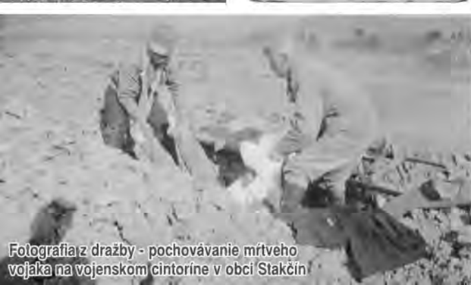
Fotografia z dražby - pochovávanie mŕtveho vojaka na vojenskom cintoríne v obci Stakčín