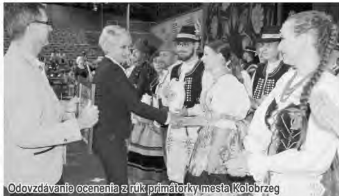
Odvzdávanie ocenenia z rúk primátorky mesta Kolobrzeg

Na festivale sa prezentovali súbory z Čie, Španielska, Kolumbie, Turecka, Gruzínska a Slovenska. Najviac nás prekvapili Gruzínci svojimi tanečnými výkonmi a Čile svojimi kostýmami. My sme zase prekvapili svojimi temperamentnými spevmi a tancami a tiež krásnymi krojmi. (ml)