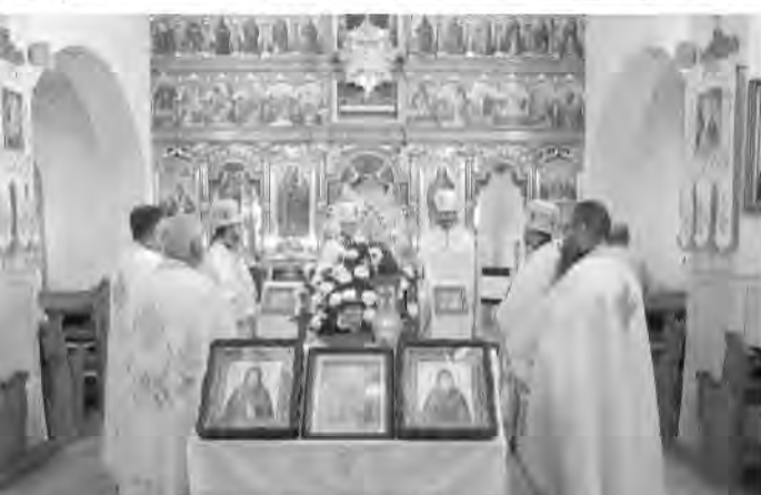
Jubilanta pozdravilo viacero duchovných aj účasťou na sv. liturgii