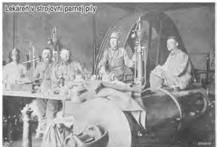
Lekáreň v strojojní parnej pily